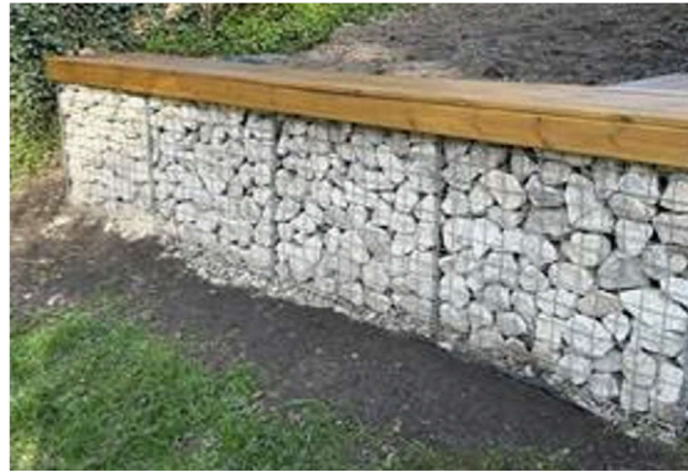
DELWEDD YN DANGOS WAL GYNNAL Y CAERGEWYLL